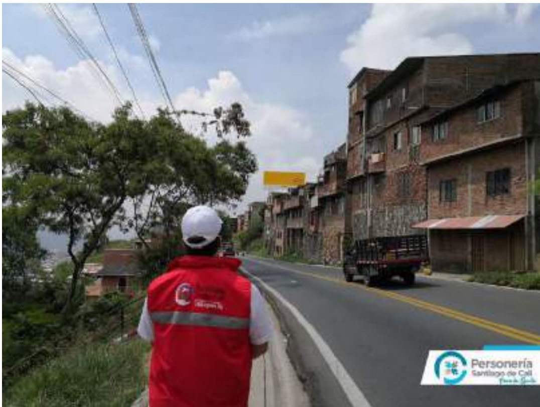
Archivo Fotográfico Personería Distrital de Santiago Cali – 2020

Ubicación: Avenida 4 a Oeste No. 12 Oeste - 67