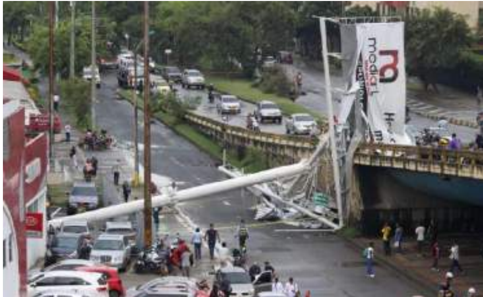
VISTA DEL EVENTO DE DESPLOME DE LA ESTRUCTURA

Con ocasión del evento de desplome de una estructura principal y sus dos vallas publicitarias, la cual se encontraba ubicada en la Carrera 80 No. 13-75, el cual se presentó el pasado 29 de Enero de 2020 la Personería Distrital de Santiago de Cali evidenció 11 luego de una evaluación detallada a las condiciones de legalidad de este elemento que: