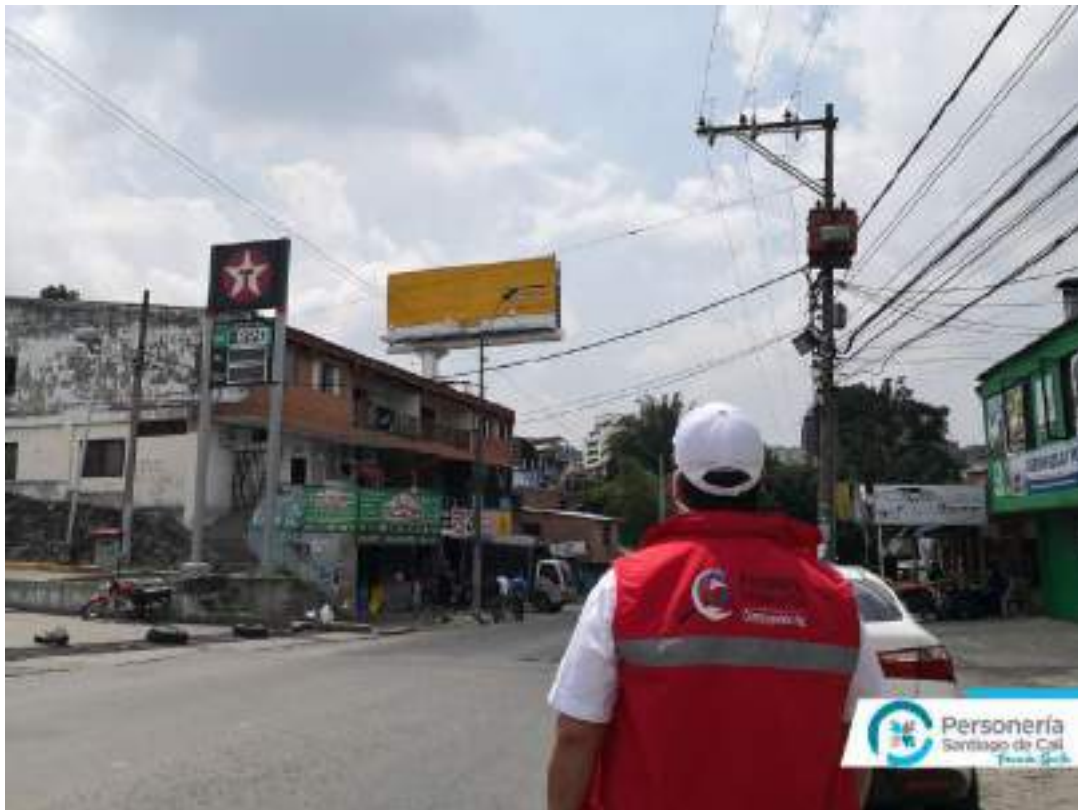
Archivo Fotográfico Personería Distrital de Santiago Cali - 2020