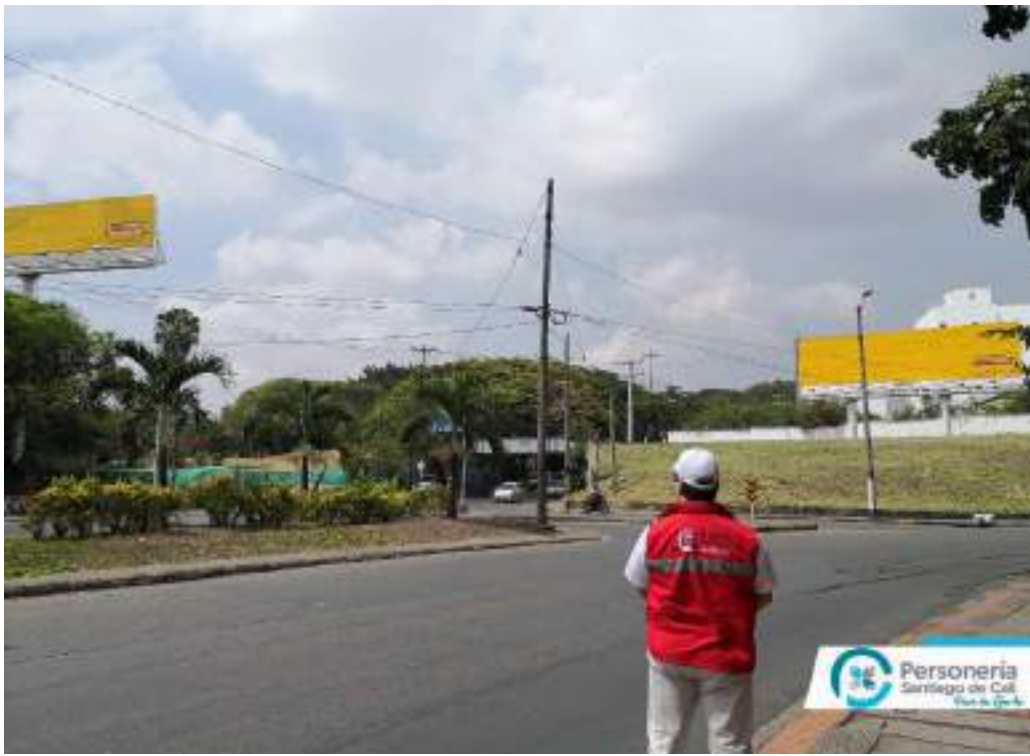
Archivo Fotográfico Personería Distrital de Santiago Cali - 2020