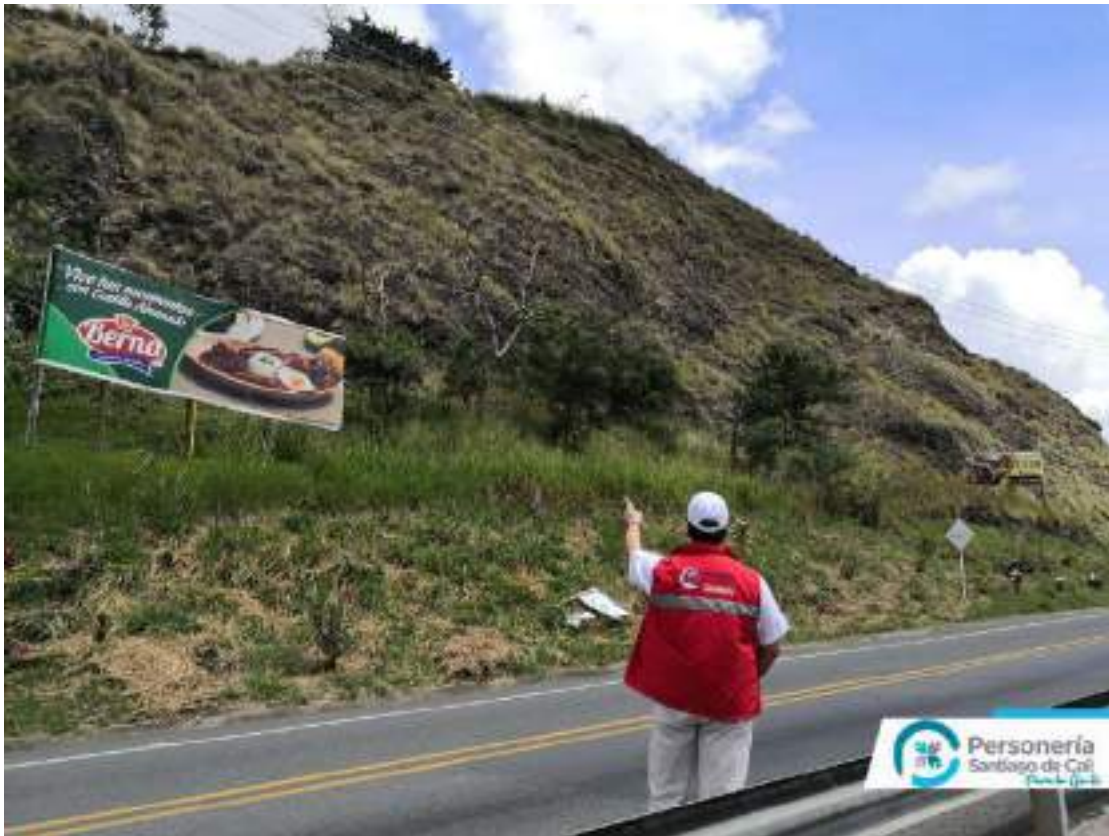
Archivo Fotográfico Personería Distrital de Santiago Cali – 2020