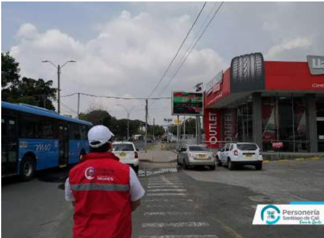
Archivo Fotográfico Personería Distrital de Santiago Cali - 2020

De otra parte y dadas las connotaciones del impacto visual que provocan los avisos publicitarios de gran extensión del segundo caso (Outlet), es necesario que la autoridad competente verifique las áreas permitidas y los tributos municipales que sobre dichas áreas se están pagando por parte del establecimiento comercial.