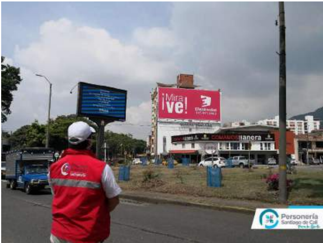
Archivo Fotográfico Personería Distrital de Santiago Cali – 2020

Ubicación: Avenida 6 N entre Carreras 48 y 49 Norte