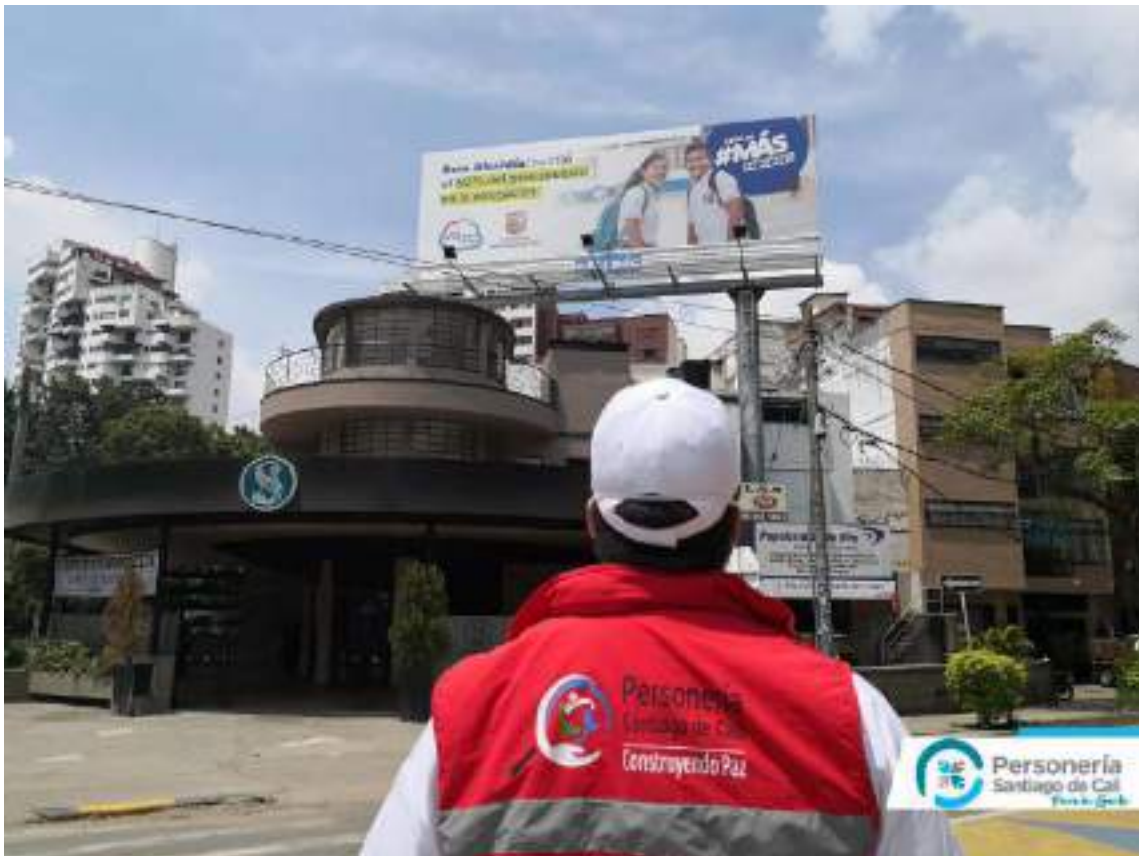
Archivo Fotográfico Personería Distrital de Santiago Cali - 2020

Propietario: C.A. Publicidad y Promociones SAS y/o City ads