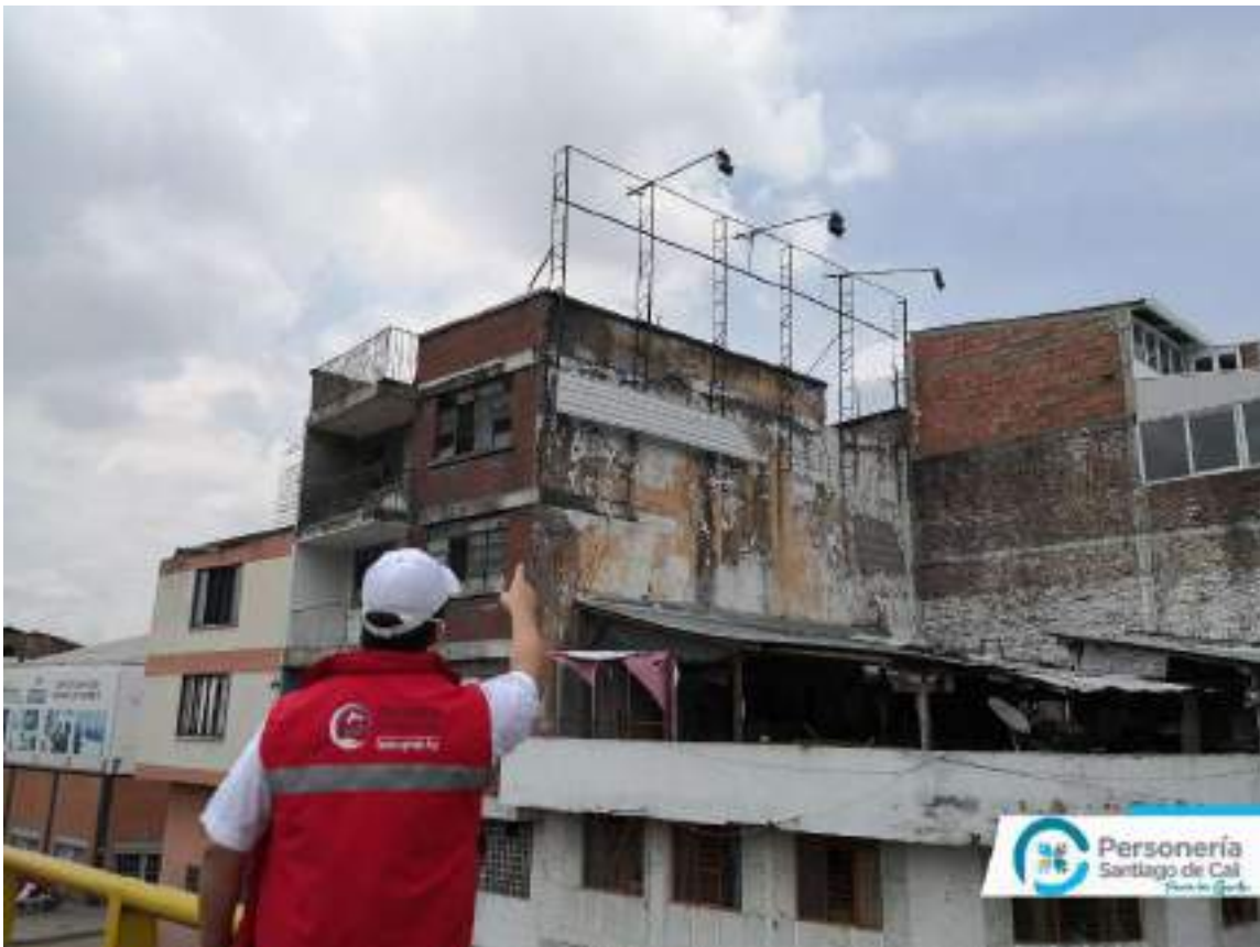
Archivo Fotográfico Personería Distrital de Santiago Cali - 2020