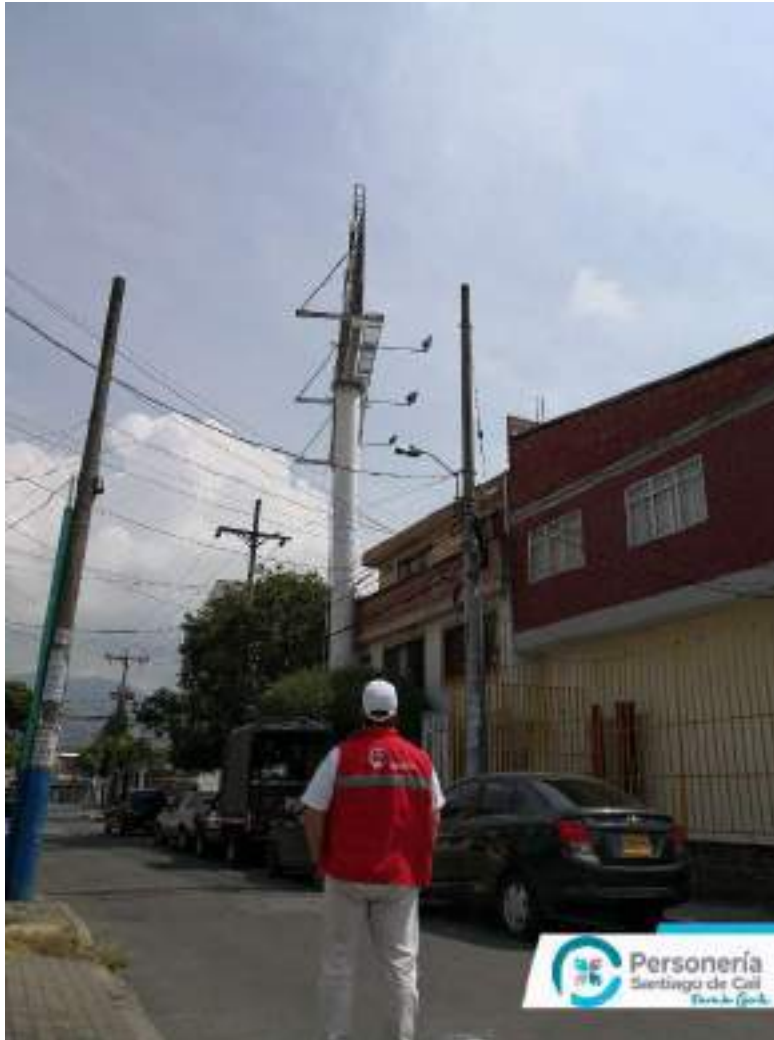
Archivo Fotográfico Personería Distrital de Santiago Cali – 2020

Ubicación: Calle 23 CN No. 3BN – 20 (Frente a Estación de Policía La Flora)